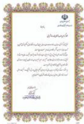
نوع تقدیر - وزارت معارف و اوقاف و صنایع مستظرفه