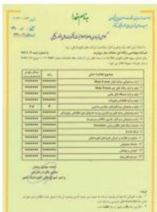
نوع تقدیر - وزارت معارف و اوقاف و صنایع مستظرفه