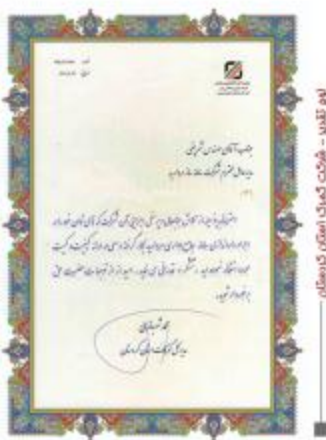
نوع تقدیر - وزارت معارف و اوقاف و صنایع مستظرفه

پس از یک دهه فعالیتهای تخصصی در زمینه تحلیل، طراحی، پیاده سازی، استقرار، آموزش، پشتیبانی و توسعه نرم افزارهای اداری، دانشگاهی و صنعتی همچنین نیاز مراکز مختلف، اعضاء گروه به این نتیجه رسیدند که به فعالیتهای خود تمرکز بیشتری بخشیده و با این هدف شرکت رایانه ای سامانه ساز مروارید در بهار ۱۳۸۳ راسما فعالیت خود را آغاز نمود، که در حال حاضر یکی از بزرگترین شرکتهای فعال در زمینه طراحی و تولید نرم افزارهای دانشگاهی، مکانیزاسیون و اتوماسیون در سطح کشور میباشد و سیاست گسترش، توسعه محصولات و خدمات از اهم اهداف این شرکت میباشد.