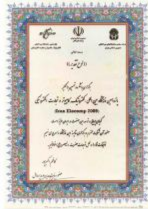
نوع تقدیر - دانشگاه بین المللی امام خمینی