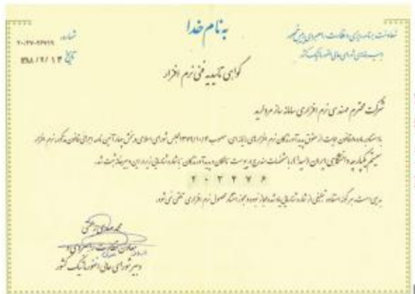
نوع تقدیر - دانشگاه بین المللی امام خمینی